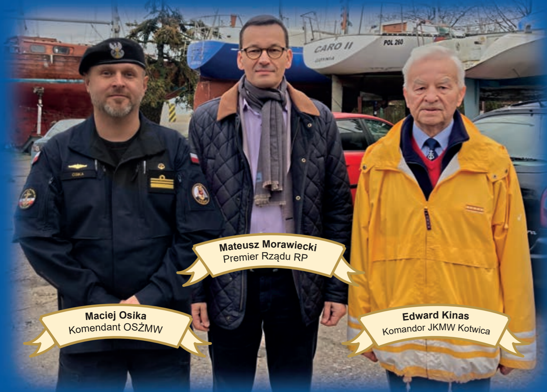
Mateusz Morawiecki Premier Rządu RP