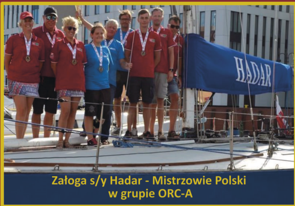
Załoga s/y Hadar - Mistrzowie Polski w grupie ORC-A